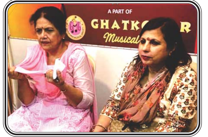
भा.सि.सभा, महिला विभाग, घाटकोपर